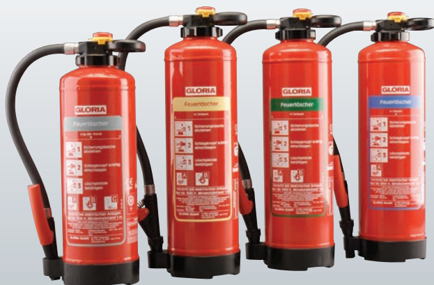
Pulver Schaum Öko-Tipp Wasser